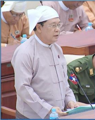
U Thein Swe