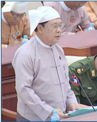
U Thein Swe