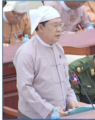
U Thein Swe